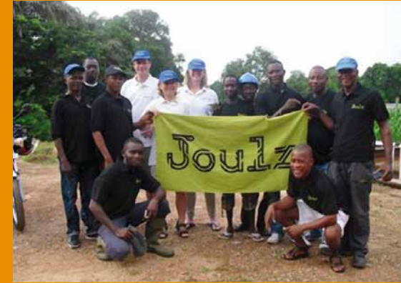
Joulz, specialist in energie-infrastructuren, op bezoek in Yele om te adviseren op het gebied van elektriciteit