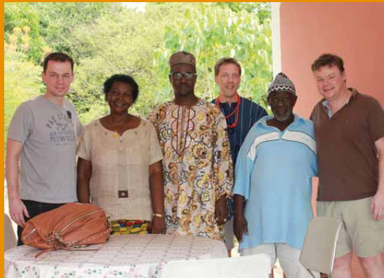
Stichting Smarter Hospital op bezoek in Yele, om computers te installeren en hierin onderwijs te geven