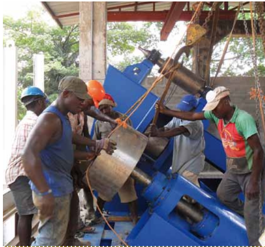
Het onderzoeken van de schade aan de turbines van de waterkrachtcentrale.