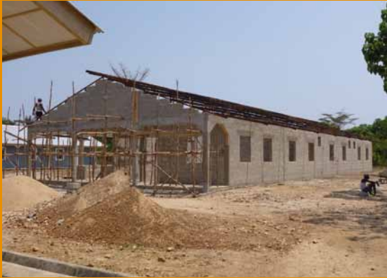
Bouw van de kraam-afdeling