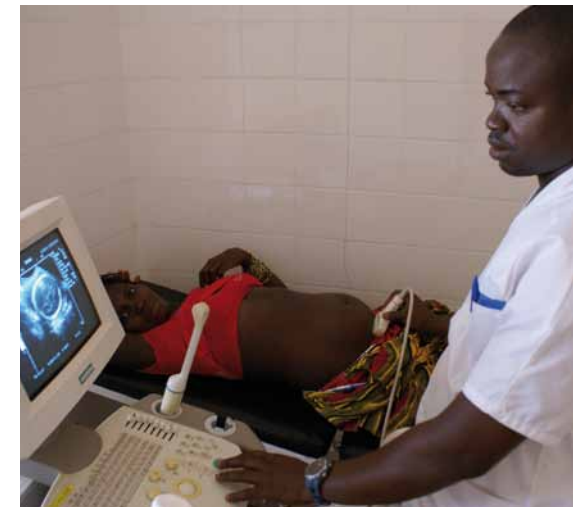
Door de aanwezigheid van echo-apparatuur in het LHMC kunnen zwangerschappen serieus begeleid worden.

In september opende de afdeling verloskunde met 2 verloskamers, 12 bedden en 2 speciale tropencouveuses.