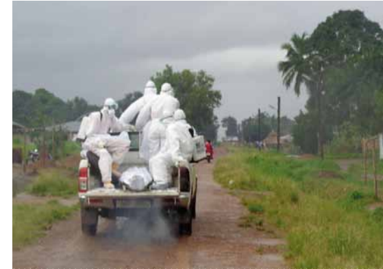
Ebola heeft in 2014 een enorme impact op Sierra Leone en de activiteiten van de Lion Heart Foundation.

Het laatste nieuws is te volgen via onze site www.lion-heart.nl en Facebook-pagina www.facebook.com/LionHeartFoundation .