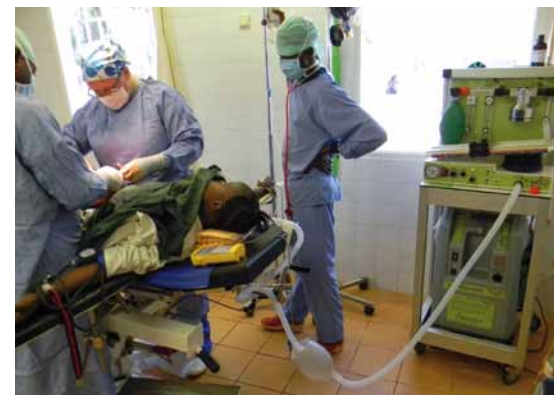
Operatie in het Lion Heart Medical Centre met gebruik van het nieuwe anesthesie-apparaat.