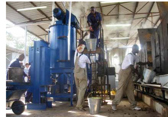
Een gedeelte van de winst van de palmoliefabriek van Nedoil komt ten goede aan gezondheidszorg en onderwijs in Yele.

De essentie van 'Best of Both Worlds' is het creëren van alternatieve inkomensstromen om sociale voorzieningen duurzaam te financieren.