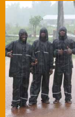
De HEMA schenkt regenpakken aan medewerkers van het LHMC.