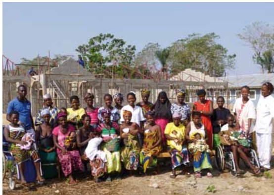
Moeders uit Yele en verplegend personeel voor de in aanbouw zijnde afdeling verloskunde van het LHMC.

In 2010 is Lion Heart begonnen met de bouw van het Lion Heart Medical Centre, om goede gezondheidszorg te kunnen bieden aan de bevolking van het Chieftdom Gbonkolenken, waar Yele de hoofdstad van is.