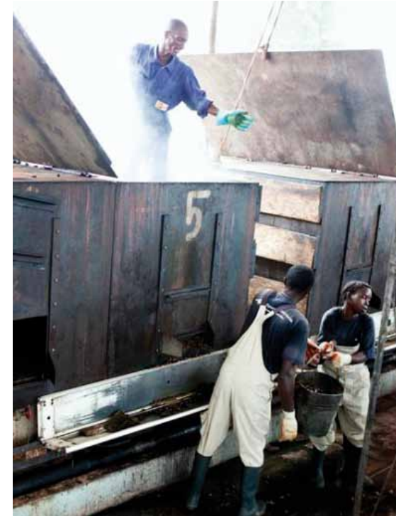
Nedoil Ltd. biedt directe werkgelegenheid aan 40 mensen én diverse kleine boeren in de directe omgeving van Yele.

Tegen het einde van 2013 zag de overname er hoopvol uit. We verwachten in het volgende jaarverslag hier meer over te kunnen vertellen. Voor Lion Heart betekent het dat wij weer een stapje dichterbij de realisatie van het Best of Both Worlds concept zijn!