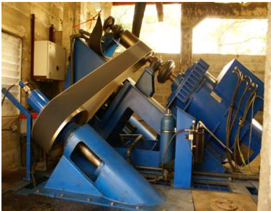
De turbine van de waterkrachtcentrale

Met veel geduld en hard werken is de waterkrachtcentrale gerepareerd en in de loop van 2012 in gebruik genomen. Zo kon er stroom worden geleverd aan het ziekenhuis, de palmoliefabriek en de 150 huishoudens die via een prepaid systeem aangesloten werden op het netwerk.