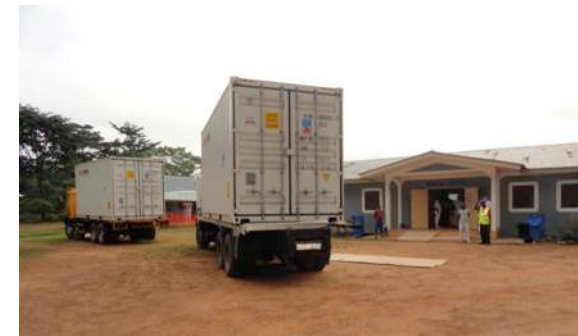
november 2014: hulpgoederen komen aan in Yele

maand later. In de tussentijd had het Nederlandse marineschip De Karel Doorman hulpgoederen voor de strijd tegen Ebola naar West-Afrika gebracht. Aan boord van het enorme schip bevonden zich twee ambulances, twee Hospitainers, een container vol beschermende materialen, 28 ziekenhuis bedden, matrassen en nachtkastjes voor het Lion Heart Medical Centre. Ook werd extra mankracht aangetrokken, zowel lokaal als uit Nederland.