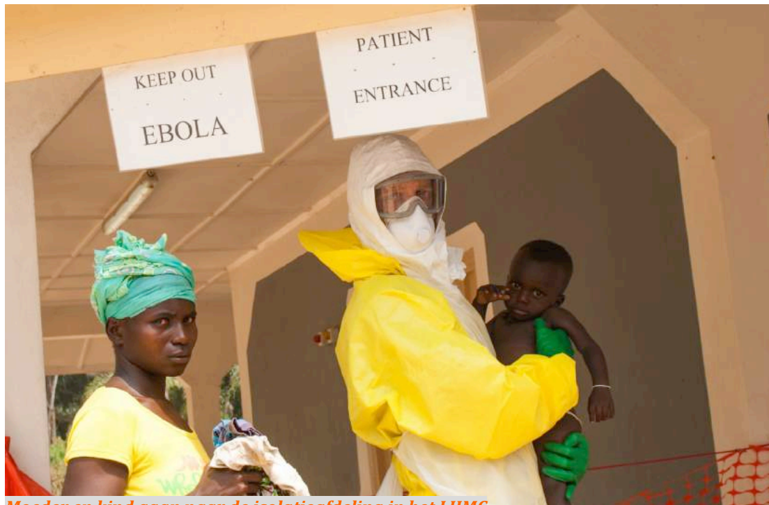
Moeder en kind gaan naar de isolatieafdeling in het LHMC