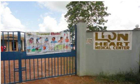
september 2014: LHMC wordt gesloten

De dagen daarna kwam alles in een stroomversnelling. Het ziekenhuis werd op last van de overheid gesloten en het personeel en de resterende patiënten werden op het ziekenhuisterrein in quarantaine geplaatst. Een onzekere en zwarte periode van 21 dagen. De twee Nederlandse artsen zijn in allerijl gerepatriëerd naar Nederland en ter observatie opgenomen in het LUMC in Leiden. Vervolgens zijn zij ook voor drie weken vrijwillig in afzondering gegaan. In de quarantaine tijd werden in Sierra Leone nog vier collega's ziek. Tot ons verdriet zijn drie van hen overleden. Een groot verlies voor ons ziekenhuis en de hele gemeenschap van Yele.