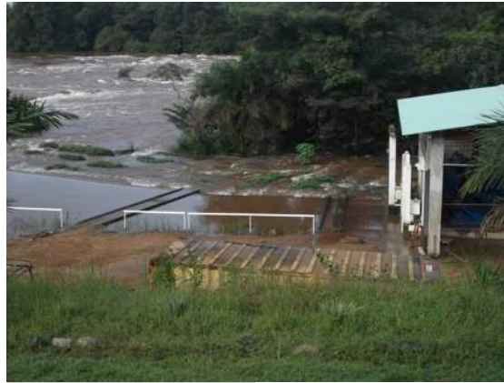
Te veel water in de rivier

2014 was een mager jaar voor Powerned. Eén van de twee turbines van de waterkrachtcentrale is nog steeds defect en hierdoor is het risico op uitval groot. Daarnaast hangt de hoeveelheid stroom, die daadwerkelijk opgewekt wordt, sterk af van het waterpeil van de rivier. Deze waterstand is weer sterk afhankelijk van de weersomstandigheden in Sierra Leone.