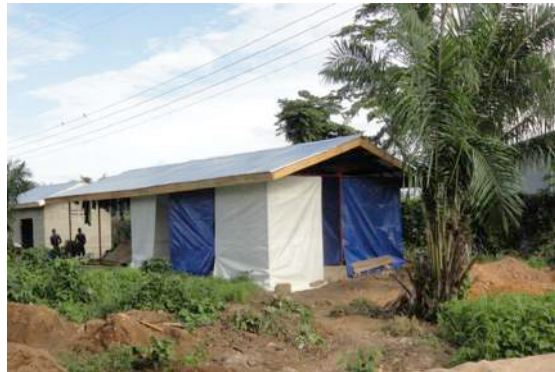
mei 2014: Geïmproviseerde isolatie afdeling

De Ebola-uitbraak begon in februari 2014 in buurland Guinee. Wat als een gezins-tragedie startte, is in korte tijd uitgegroeid tot een crisis van enorme proporties. Na het eten van besmet vleermuizen vlees werd de familie in Guinee erg ziek. De begrafenis van deze eerste slachtoffers van Ebola zorgde voor verdere verspreiding van het virus. Eind mei maakte de WHO melding van de eerste Ebola-doden in Sierra Leone.