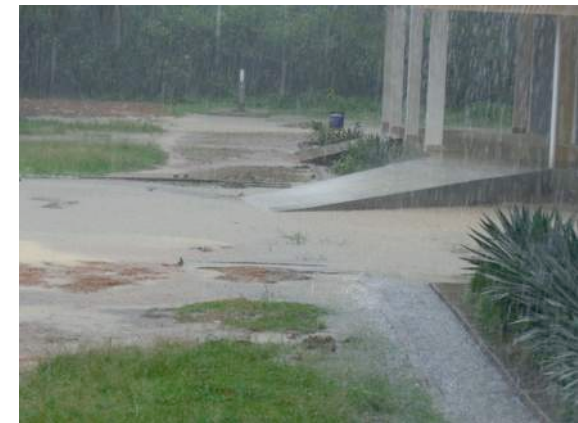
Het regenseizoen in Yele

De vurige wens om op duurzame wijze energie uit water te produceren is nog altijd aanwezig. Het komende jaar zal voor Powerned wederom in het teken staan van het aanvragen van subsidies voor de reparatie van de turbine en het aanpassen van de loop van de rivier, zodat de waterinlaat beter beheersbaar is.