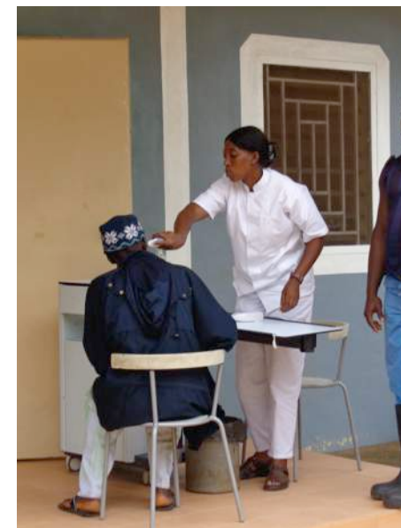
Ook bezoekers worden getemperatuur