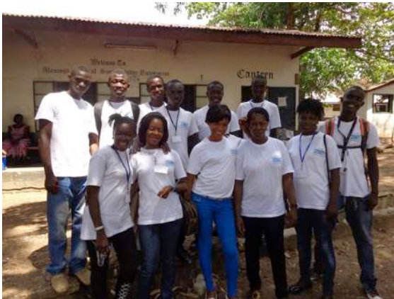
Leerlingen opleiding Nursing Aids in het LHMC

Lion Heart gelooft in de kracht van het individu. Eén mens kan het verschil maken in het leven van velen. Daarom leiden wij mensen op in hun eigen gemeenschap. Wij werken op een praktische, hands-on manier. Zo leren we de bevolking vaardigheden om hun potentieel optimaal te gebruiken en op die manier te zorgen voor hun familie, gemeenschap en zichzelf. Zelfredzaamheid staat bij Lion Heart altijd voorop.