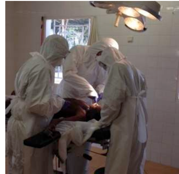
Operatie in PPE

Tegen het einde van het jaar begint het aantal patiënten in het ziekenhuis weer langzaam te stijgen en lijkt Ebola voorzichtig op zijn retour. De veiligheidsmaatregelen in het ziekenhuis blijven echter onverminderd van kracht. Iedere patiënt is een potentieel besmettingsgevaar en het risico is nog lang niet geweken.