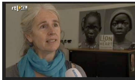
september 2014: heel veel media aandacht

De repatriëring van onze artsen veroorzaakte een hoos aan media aandacht in Nederland. Lion Heart werd overspoeld door cameraploegen en journalisten die het laatste nieuws wilden weten over de mogelijke besmetting en de aanpak van Ebola in Sierra Leone. Voor Lion Heart was dit een drukke periode van politieke lobby en PR, terwijl de fondsenwerving in de hoogste versnelling moest worden doorgezet.