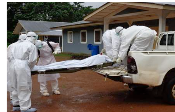
september 2014: Ebola bereikt het LHMC

Op 8 september bereikte het virus daadwerkelijk het LHMC. Een man meldde zich in het ziekenhuis met uitdrogingsverschijnselen. Hij had geen koorts en kwam op de gewone verpleegafdeling te liggen. 's Avonds kreeg hij hoge koorts en is hij direct naar de isolatieafdeling gebracht. Die nacht overleed hij. Een vrouw die zich had gemeld met keelklachten overleed ook, net als een van onze eigen collega's. De bewuste patiënten waren bij opname nog niet verdacht van Ebola. Ze hadden geen koorts en voldeden niet aan de